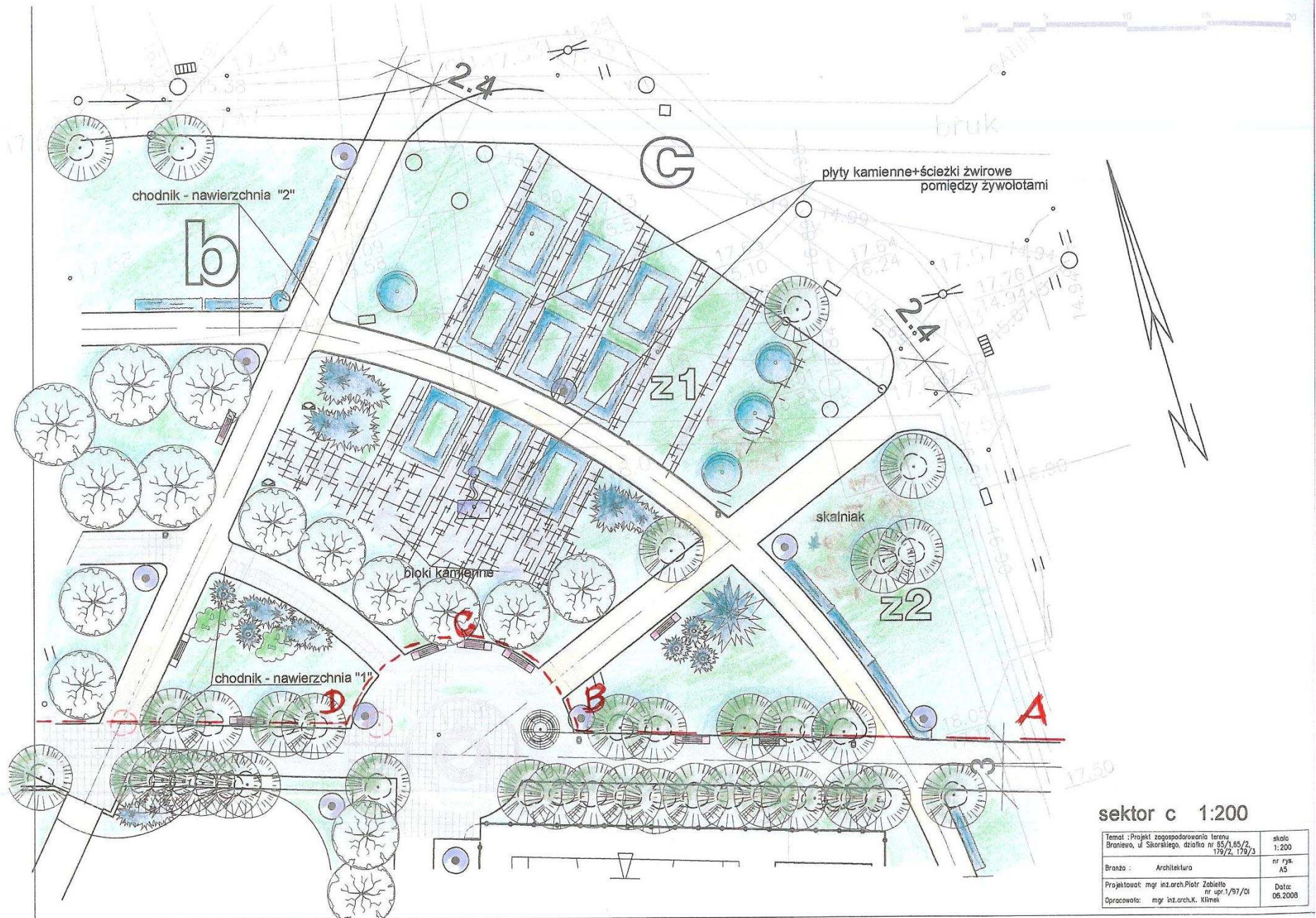
sektor c 1:200